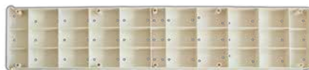
Passobeach parte inferiore