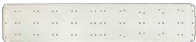
Passobeach parte superiore