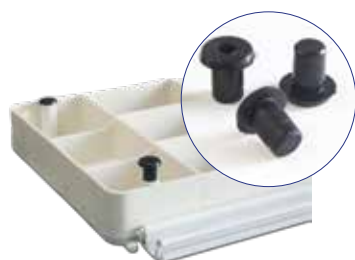
Piedini in gomma per posa su superfici porose