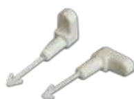
Fermagli di ricambio